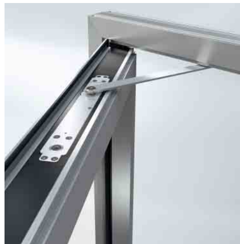
Verdeckt liegender Türschließer – keine Unterbrechung der klaren Linienführung Concealed door closer – clean lines of design not interrupted