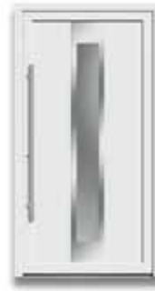
5866 S. 28