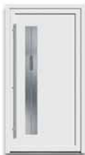
5778 S. 22