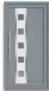
5784 S. 14