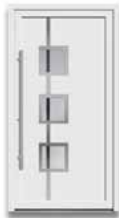
5889 S. 12