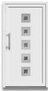
5705 S. 35