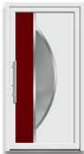
5864 S. 17