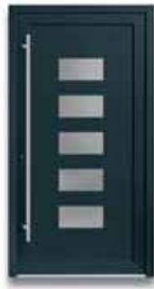
5873 S. 31