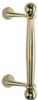
9002-1 Messing poliert