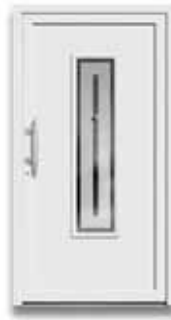
5115 S. 30