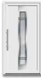
5891 S. 28