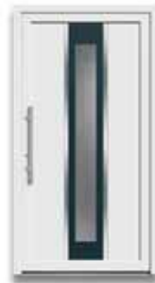
5863 S. 15