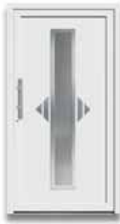
5657 S. 29