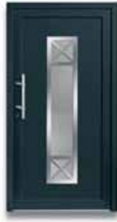
5286 S. 27