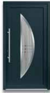
5114 S. 42-43