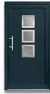
5503 S. 34