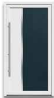
5862 S. 16