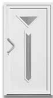
5305 S. 52