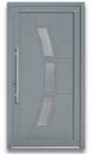
5883 S. 46-47