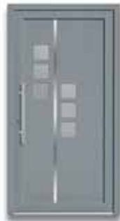
5783 S. 11