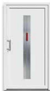
5777 S. 23