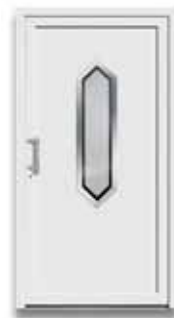
5022 S. 50