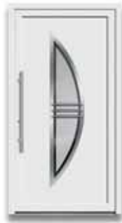
5890 S. 42-43