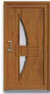
5857 S. 44-45