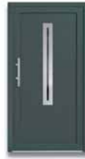
5772 S. 30