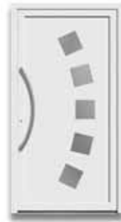
5881 S. 46