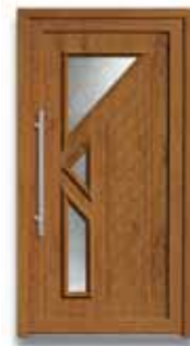
5335 S. 54-55