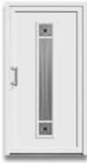
5186 S. 26