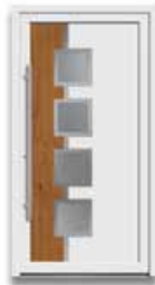
5787 S. 13