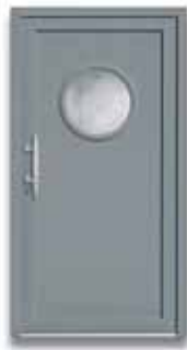
5156 S. 37