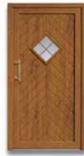
5323 S. 39