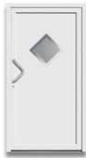
5023 S. 38