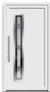
5178 S. 22