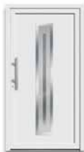
5177 S. 20-21