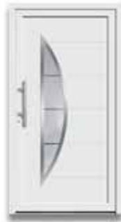
5878 S. 44-45