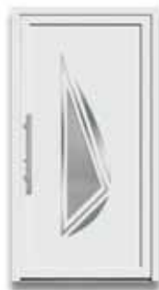
5884 S. 48