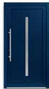
5865 S. 24