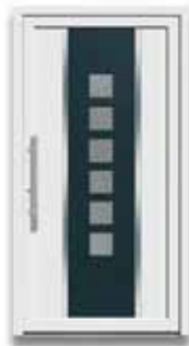
5782 S. 10-11