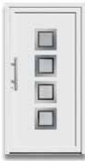
5504 S. 32-33