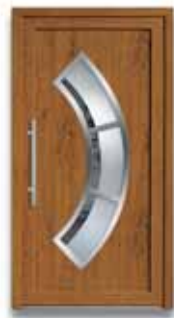
5882 S. 47