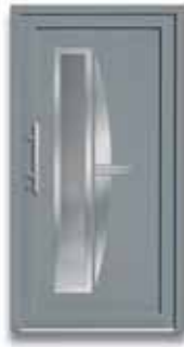
5656 S. 29