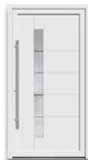
5869 S. 24