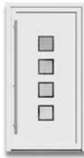
5704 S. 33